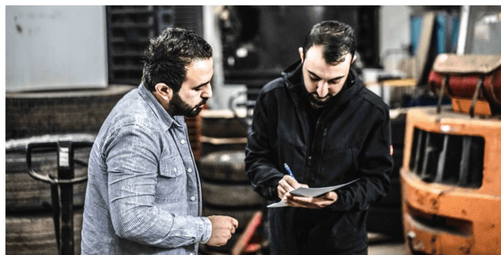
Azubibesuch bei der Firma